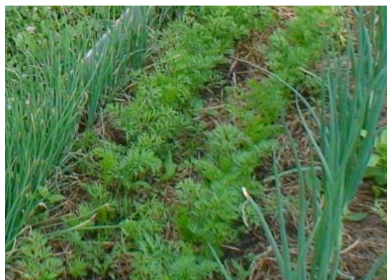
Зураг 2: Холимог тариалалт