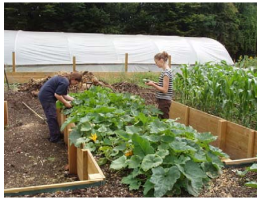
Зураг 3: Хайрцган дахь тариалалт