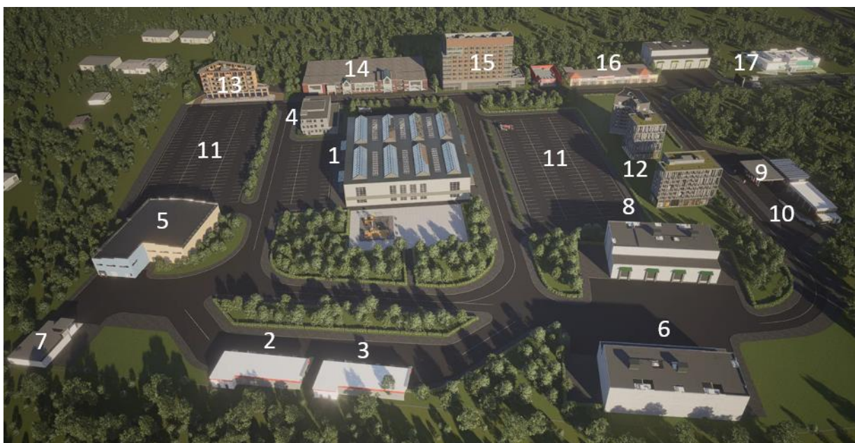
Зураг 3: Хүнсний ногооны хадгалалт, борлуулалт, түгээлтийн цогцолбор төвийн объектууд

1-бөөний худалдааны төв, 2- хүнсний чанар, аюулгүй байдлын лаборатори, 3-бүдүүн ногооны агуулах, 4-нарийн ногооны агуулах, 5-бараа материалын агуулах, 6-хүнсний ногоо боловсруулах цех, 7-сав, баглаа боодлын цех, 8-авто засварын газар, 9-шатахуун түгээх станц, 10-автомашин угаалгын газар, 11-автомашину зогсоол, 12-зочид буудал, 13-захиргааны байр, 14- үйлчилгээний төв, 15-ажиллагсдын орон сууц, 16-ажиллагсдын үйлчилгээний байр, 17-хог хаягдал ангилах байгууламж