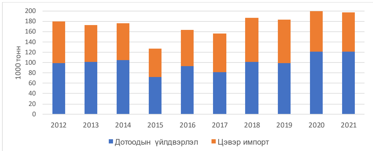
Зураг 1: Хүнсний ногооны нийт нийлүүлэлт, түүний бүтэц 2012-2021 онд

импортолж, үүнд 19.3 сая ам.доллар зарцуулжээ. Сүүлийн 10 жилийн дунджаар хүнсний ногооны нийлүүлэлт 174 мянган тонн, түүний 57 хувийг дотоодоос хангаж байна (1-р зураг).